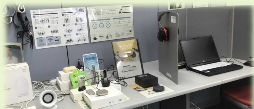
デジタル補聴システム、ノイズキャンセラー、イヤーマフ、パーテーションなど