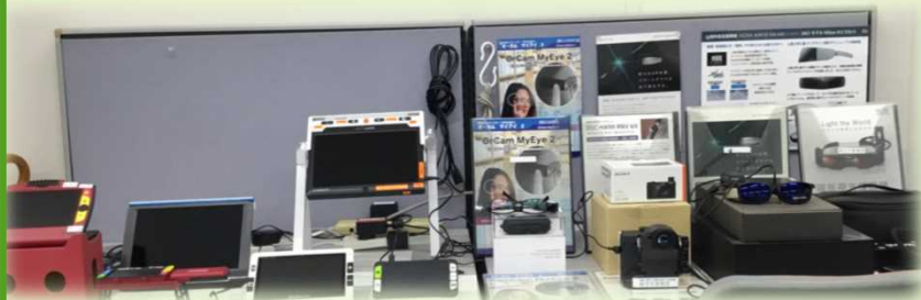
携帯型拡大読書器、視覚障害者向け先端機器など