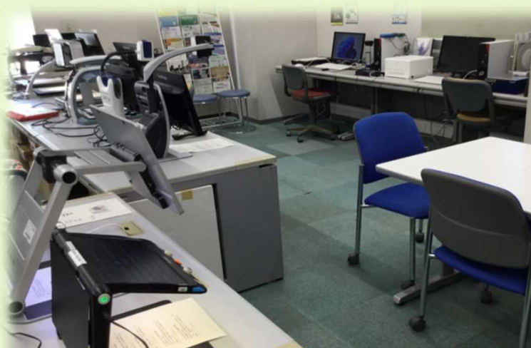
拡大読書器、支援ソフト搭載パソコンなど

令和7年4月より、機器の展示スペースを拡充しました。 実際に手に取って試していただけますので、ぜひお立ち寄りください。