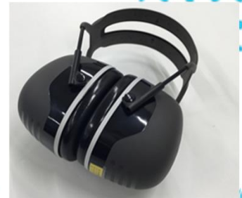
感覚過敏の方向け機器 ＜イヤーマフ＞