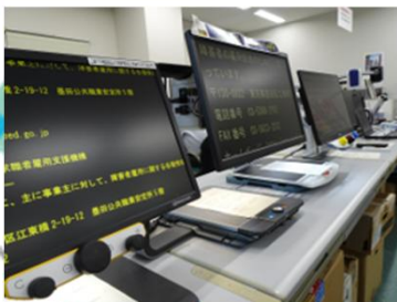
視覚障害向け機器 ＜据置型拡大読書器＞