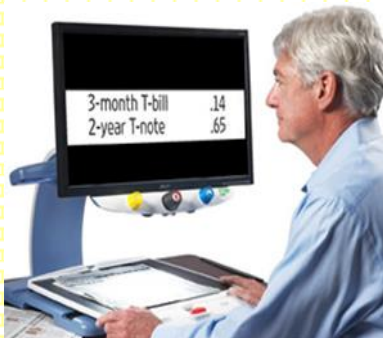
視覚障害者向け機器 据置型拡大読書器