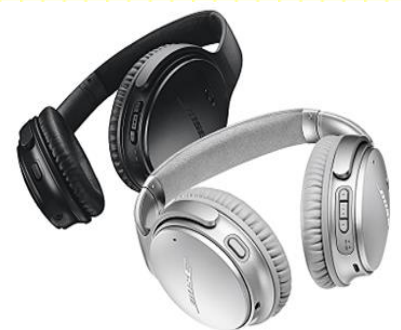
知的・発達障害者向け機器 ノイズキャンセリングヘッドホン