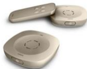
聴覚障害者向け機器 デジタル補聴支援システム