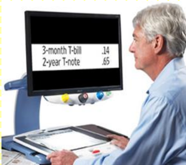
視覚障害者向け機器 据置型拡大読書器